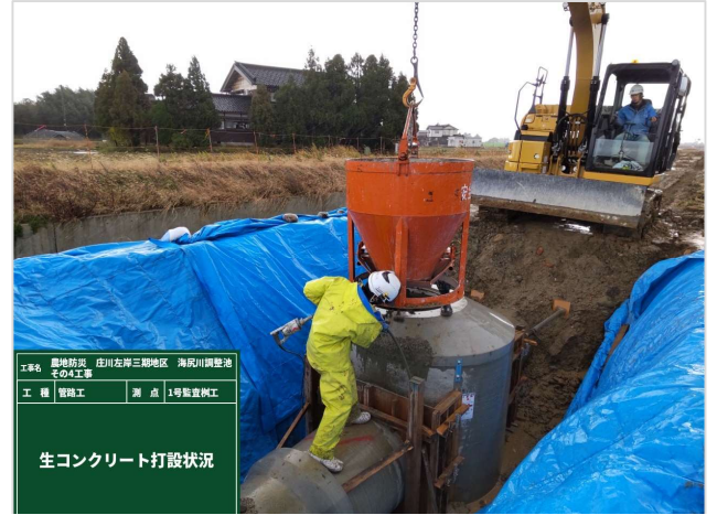
生コンクリート打設