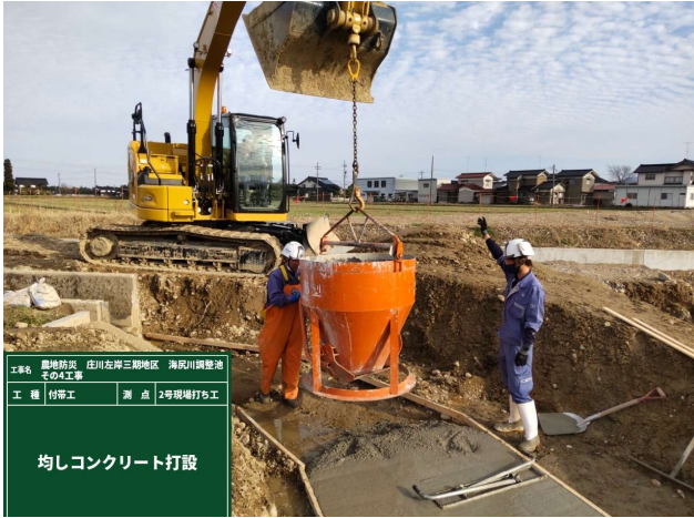
均しコンクリート打設