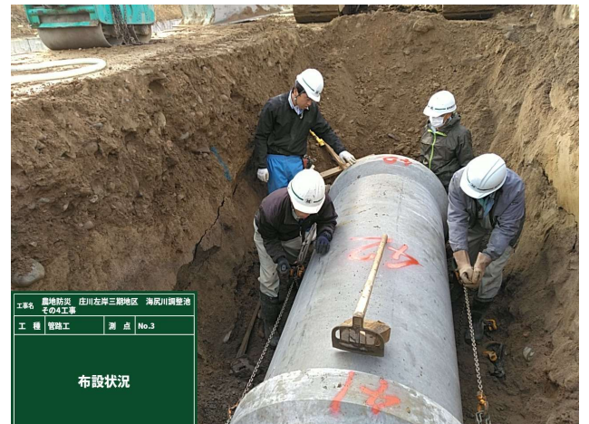
打設 (写真内は下請会社)